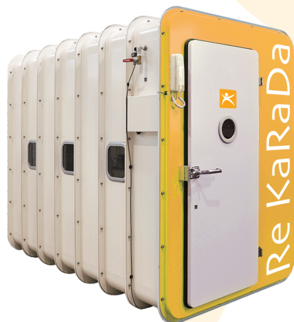
定員 3 名 NR-100E-3

本体重量 495kg 出入口部寸法： 1,500×600mm 本体外寸： H 1,828mm W 1,308mm D 2,239mm