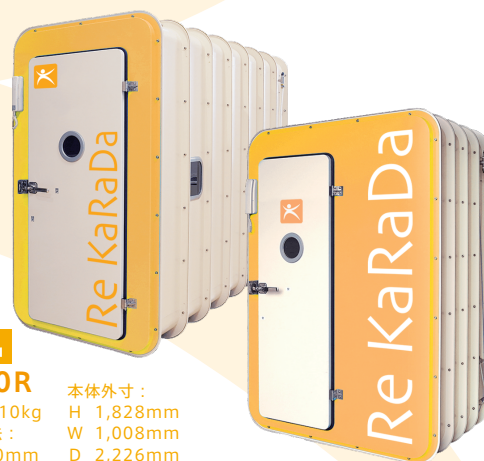
定員 1 名 NR-100R

本体重量 495kg 出入口部寸法： 1,500×600mm 本体外寸： H 1,828mm W 1,308mm D 2,239mm